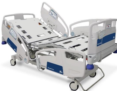
(Zdjęcie poglądowe oferowanego łóżka)

Czy Zamawiający wyrazi zgodę na zaoferowanie materaca w pokrowcu paroprzepuszczalnym, nie przepuszczającym wody, pokrowiec odpinany min. 180°, zamek zabezpieczony przed wnikaniem płynów, wysokość materaca 140 mm, materac posiadający powierzchnię górną falistą w okolicy pleców, ud i podudzi dla lepszej dystrybucji ciężaru pacjenta, łączenie pokrowca zgrzewane?